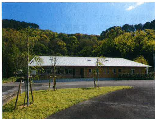
【林業人材育成棟 外観】