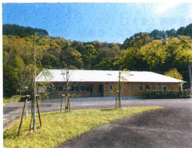
【林業人材育成棟 外観】