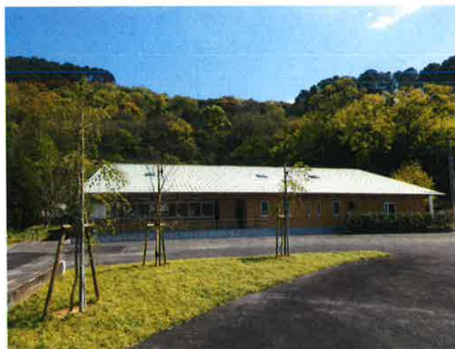
【林業人材育成棟 外観】