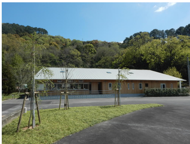
【林業人材育成棟 外観】